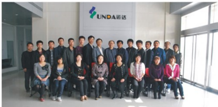
首次全体通讯员会议召开